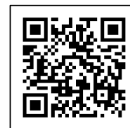
Web 申込 QR コード

※期日まで応募書類の提出がない場合は受験することができませんのでご注意ください。